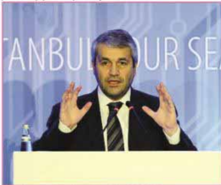
Bilim Sarayı ve Teknoloji Bakanı Nihat ERGÜN

"Hepimiz enerji tüketimindeki tasarrufa odaklanmış durumdayız ve bu iyi bir gelişme. Ancak artık mercelerimizi biraz da elektrik üreten ve dağıtan şirketlerin verimliliği noktasına çevirmemiz gerekiyor. Bakanlık olarak, önümüzdeki süreçte, bu konuyla ilgili çalışmalar yapmayı da planlıyoruz. 6 ayda bir Bilim Teknoloji Yüksek Kurulu toplanmaktadır. Önümüzde tek bir konu var; enerji. Burada önemli kararların alınacağını göreceğiz" diye konuştu. Bu belgedeki ikinci hedefin sektörün Ar-Ge, inovasyon ve markalaşma becerisini geliştirmek olduğunu ifade eden Ergün, şunları söyledi: "Sektör için büyük önem arz eden Krom Nikel paslanmaz çelik sac, silisyumlu çelik, süper alaşımlar gibi ara ürünlerin ülkemizde üretimine yönelik çalışmalar yapılacaktır. Madenlerden sanayide kullanılacak yeni malzemeler üretilmesi konusundaki yerimiz,