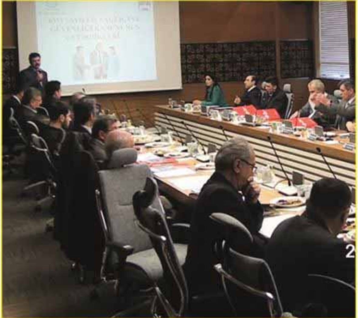
Kooperatif Başkanları ve Yöneticileri sunum sırasında

İkitelli Organize Sanayi Bölgesi Başkanlığı'nın düzenlediği ve evsahipliğini üstlendiği bilgilendirme ve istişare toplantıları devam ediyor. Son olarak İkitelli'de bulunan Kooperatif Başkanları ve Yöneticileri'nin katıldığı toplantıda; TSE'nin işleyişi, güneş enerjisi, markalaşma, iş sağlığı ve güvenliği konularında brifingler verildi.