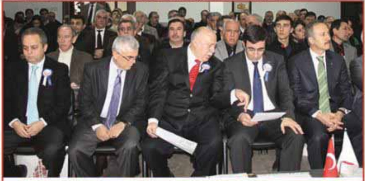
Nihat TUNALI, Kalkınma Bakanı Cevdet YILMAZ ve Avrasya Bir Vakfı Genel Başkanı Şaban GÖLBAĞAR ile konferansta

Yılmaz, bölgeler arası dengenin de önemine işaret ederek, "GAP bölgesinde yaptığımız yatırımlarla 400 bin yeni istihdam sağladık. GAP'ın ihracatı, toplam ihracatımızda 8 milyar doları aştı. İkitelli'nin ihracatı ile GAP'ın ihracatı aşağı yukarı aynı. Bundan 10 yıl önce GAP bölgesinin ihracatı 700 milyon dolar bile değildi. Bu 10 yılda bölgenin ihracatı 12 kata yakın artmış" diye konuştu.