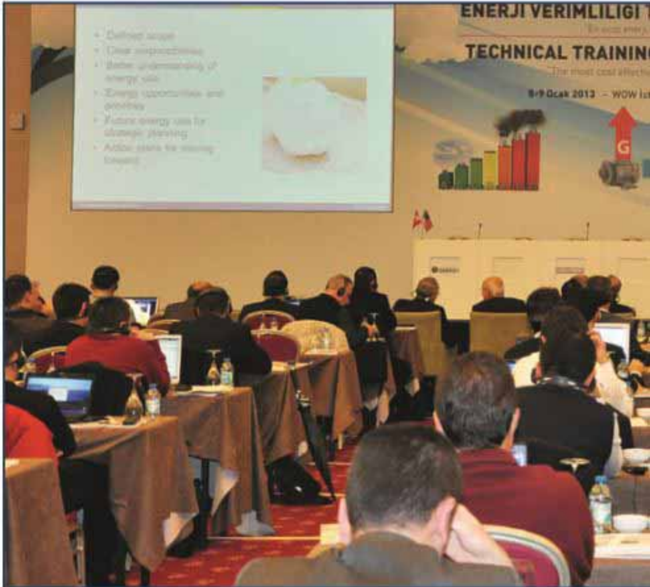
Enerji Verimliliği Teknik Eğitim Programı sunumu sırasında

8-9 Ocak 2013 tarihlerinde İstanbul WOW otelde 2 gün süren 'ENERJİ VERİMLİLİĞİ TEKNİK EĞİTİM PROGRAMI' yapıldı. Geniş bir katılımıla gerçekleştirilen zirvede İOSB Yöneticileri ve Teknik Kadrosu hazır bulundu.