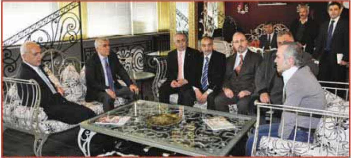
Demirciler Sanayi Sitesinde bir firmanın üretimlerini incelerken

Ardından Demirciler Sanayi Sitesi'ne geçen MUTLU, burada da esnafa sohbet ederek incelemelerde bulundu.