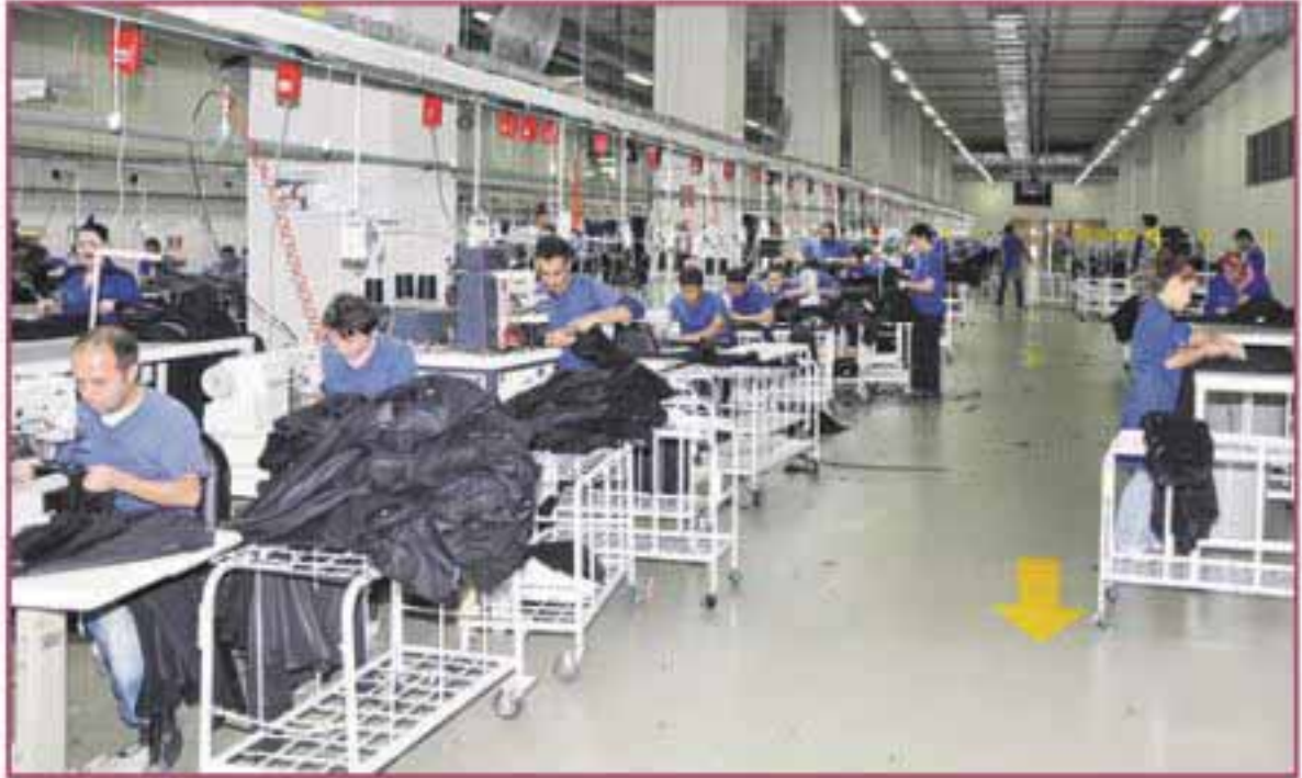
Bir tekstil fabrikasından görüntü

düzenliyoruz. İkitellideki sorunları masaya yatırıyoruz.