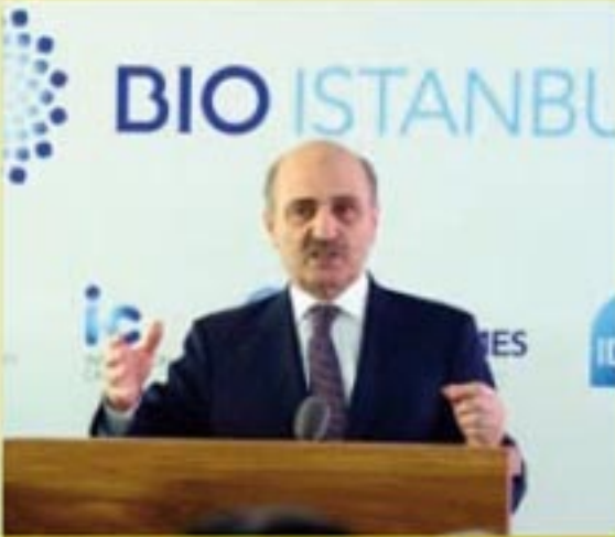
Erdoğan BAYRAKTAR Çevre ve Şehircilik Bakanı