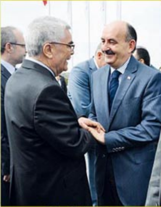
Nihat TUNALI ve Sağlık Bakanı Mehmet MUEZZİNOĞLU