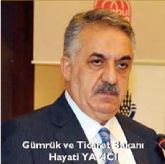
Gümrük ve Ticaret Bakanı Hayati YAZICI

Gümrük ve Ticaret Bakanı Hayati Yazıcı, Yıldız Teknik Üniversitesi tarafından Haliç Kongre Merkezi'nde düzenlenen "Hedef 2023: Lider Ülke Genç Türkiye" adlı zirvedeki "Türk Dış Politikası ve Kapasite İnşası 2023" oturumunda yaptığı konuşmada, dünya ekonomisinin 2012'de yüzde 3,2 büyüdüğünü, büyümenin 2013'te yüzde 3,3; 2014'te ise yüzde 4 olmasının öngörüldüğünü söyledi.