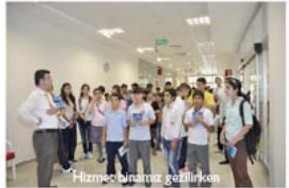
Hizmet Binasını gezilirken

Gezinin amaçları arasında yer alan Sanayi ve Sınayi Kuruluşlarını Tanımak kapsamında bölgemizde faaliyet gösteren Adell Armatürü de dolaşan öğrenciler ve yöneticiler memnuniyetlerini dile getirerek programlarını tamamladılar.