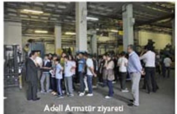
Adell Armatür ziyareti