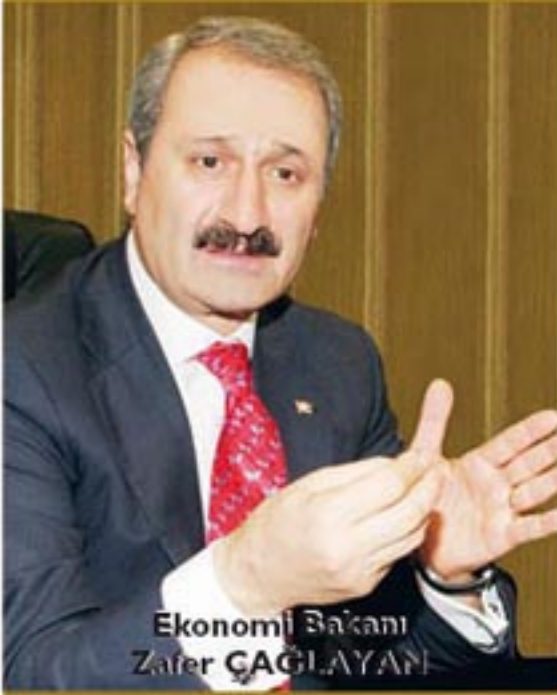
Ekonomi Bakanı Zafer ÇAĞLAYAN

Ekonomi Bakanı Zafer Çağlayan, Türk Eximbankın kredi faiz oranlarını indirmesi ve sunacağı yeni destekler konusunda, "Eximbankın yeni uygulamaları ve kredileri ihracatçımız için bir can simidi niteliği taşıyacak" dedi.