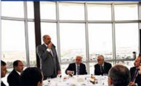
Mevlüt UYSAL toplantıda konuşurken