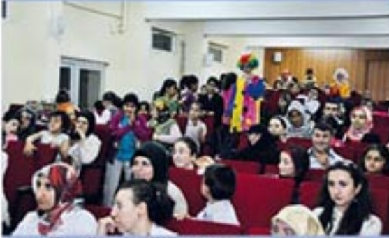
Engelli çocuklar etkinlikte çok mutlu idi