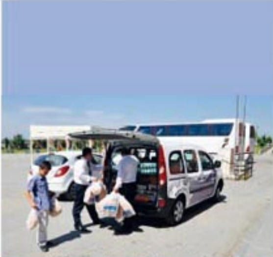
IOSB çalışanları okula yemek taşıırken