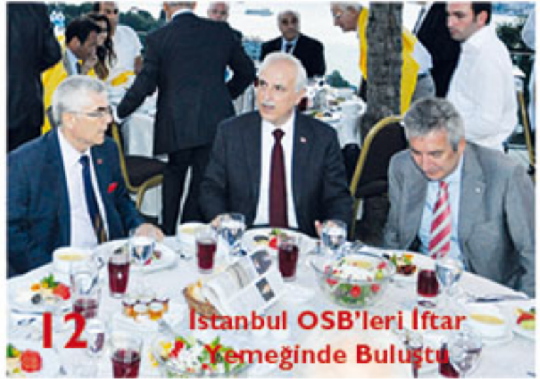
12 İstanbul OSB'leri İftar Yemeginde Buluştu