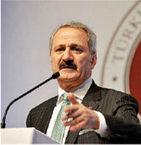
Zafer ÇAĞLAYAN Ekonomi Bakanı