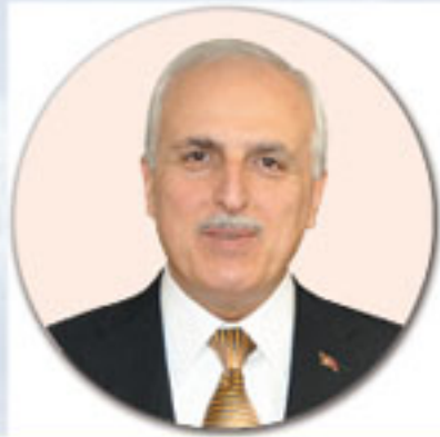
Hüseyin Avni MUTLU

İstanbul Valisi, İOSB Müteğebbis Heyet ve Yönetim Kurulu Başkanı