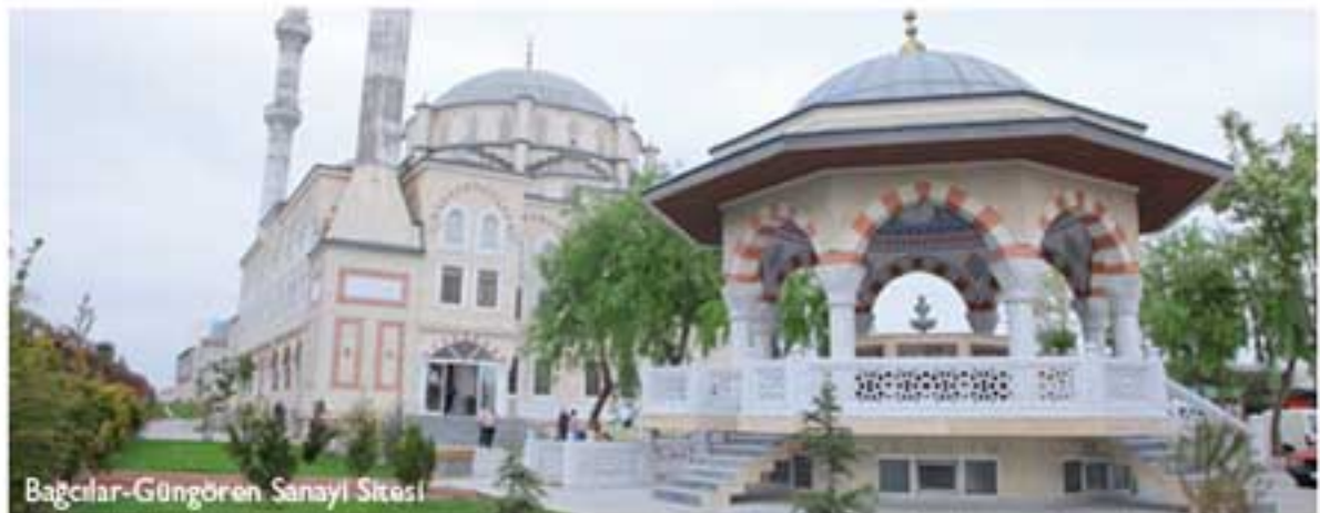
Bağcılar-Güngören Sanayi Sitesi

İkitelli OSB Haber: Tersten düşünebilir miyiz?