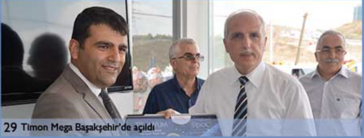
29 Timon Mega Başakşehir'de açıldı