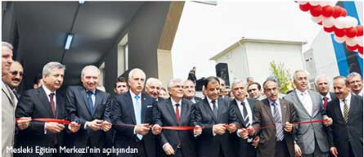
Mesleki Eğitim Merkezi'nin açılışından

16 Haziran 1986 yılında çıkan yasada: " Hiç kimse, hiçbir işyeri ustalık belgesi olmadan işyeri açamaz" diyor. Bu uygulansa bu okulların önünde kuyruk olur.