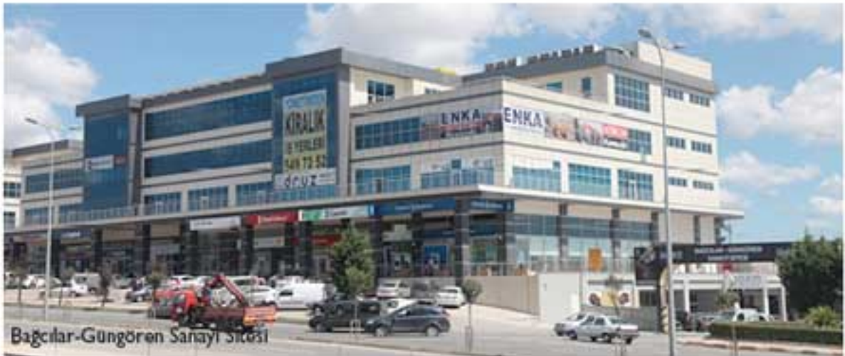
Bağcılar-Güngören Sanayi Sitesi

Bakınız biz bu gelişmelerin farkındayız ve sanayicimizin işini kolaylaştırmak için elimizden geleni yapıyoruz. Mesela; OSB'de enerjiyi ucuz veriyoruz. OSB olarak mesleki eğitim merkezi açtık ve endüstri meslek lisesi açıyoruz. Bunlar çok önemli, çok ciddi katkılardır. Enerji ve eğitim bir ülkenin en önemli iki kalemidir.