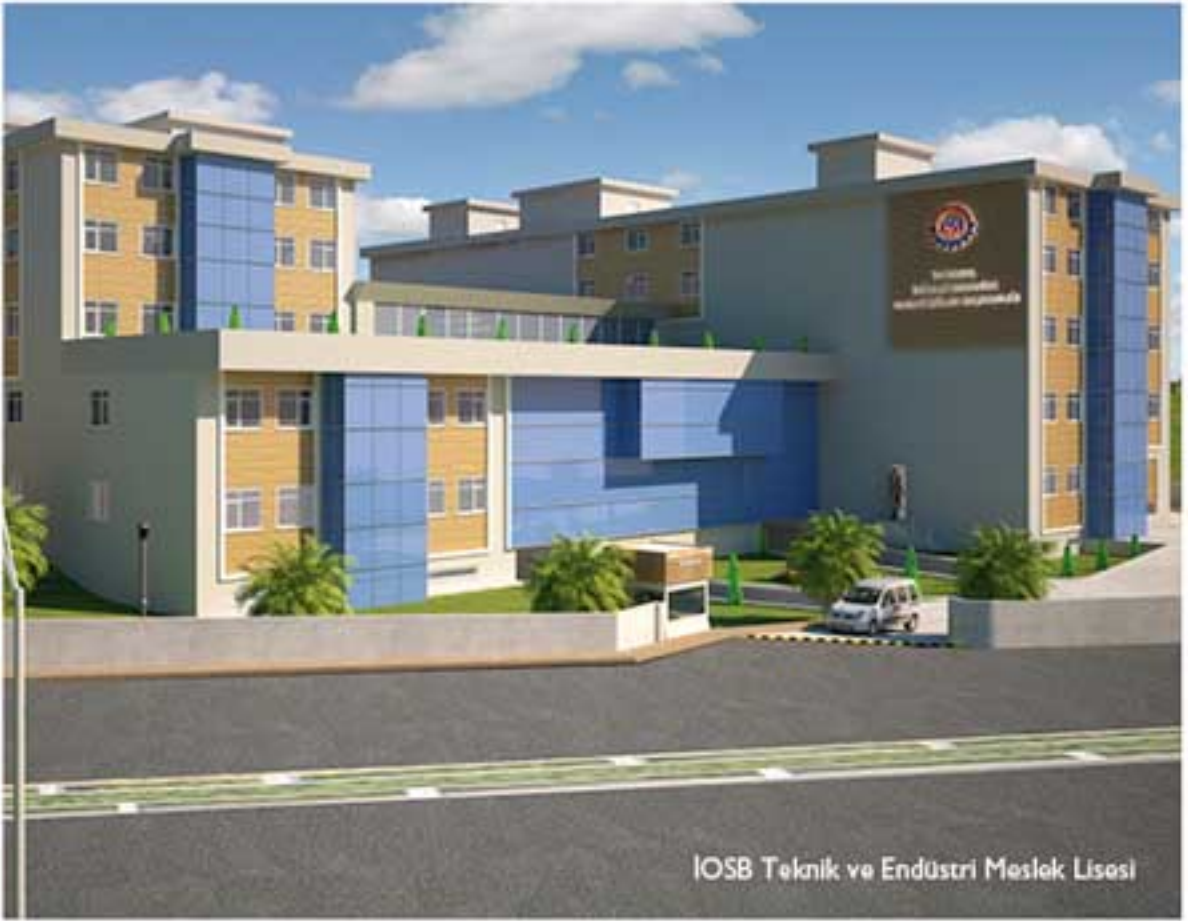
IOSB Teknik ve Endüstri Meslek Lisesi

çıkıyoruz. Bu ve bunun gibi gedrilerimiz ve iyi yönetim bizi bu noktalara getirdi.