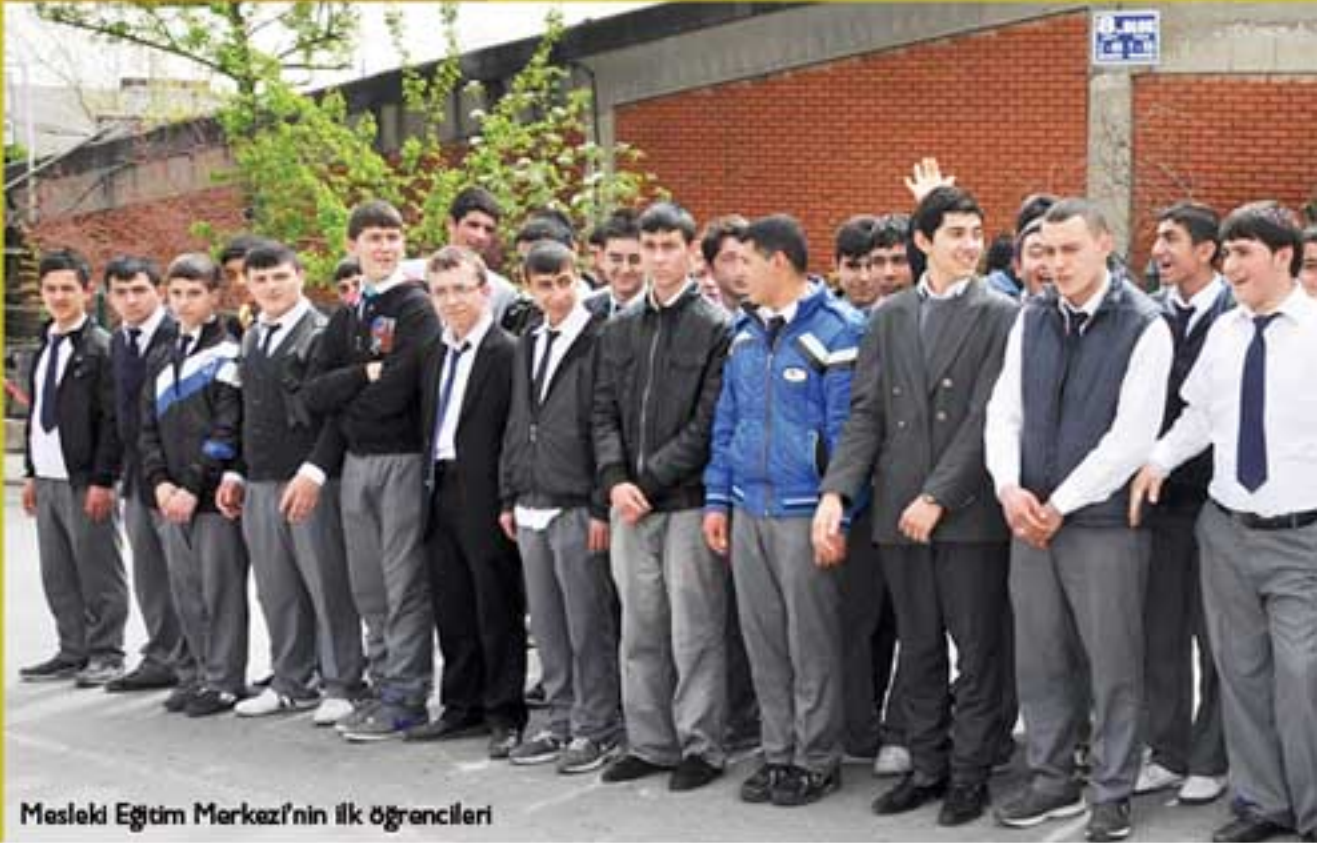
Mesleki Eğitim Merkezi'nin ilk öğrencileri

Bağcılar-Güngören sanayi sitesinde 1300'e yakın esnafımız var. Bunların 300'ünde ustalık belgesi vardır. Diğer 1000 tanesinde ustalık belgesi yok ama ruhsatları var. Belediyeler maalesef ruhsat alırken işyerlerinden ustalık belgesi istemiyorlar.