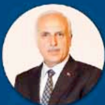
Hüseyin Avni MUTLU İstanbul Valisi İOSB Müteşebbis Heyet ve Yürütme Kurulu Başkanı