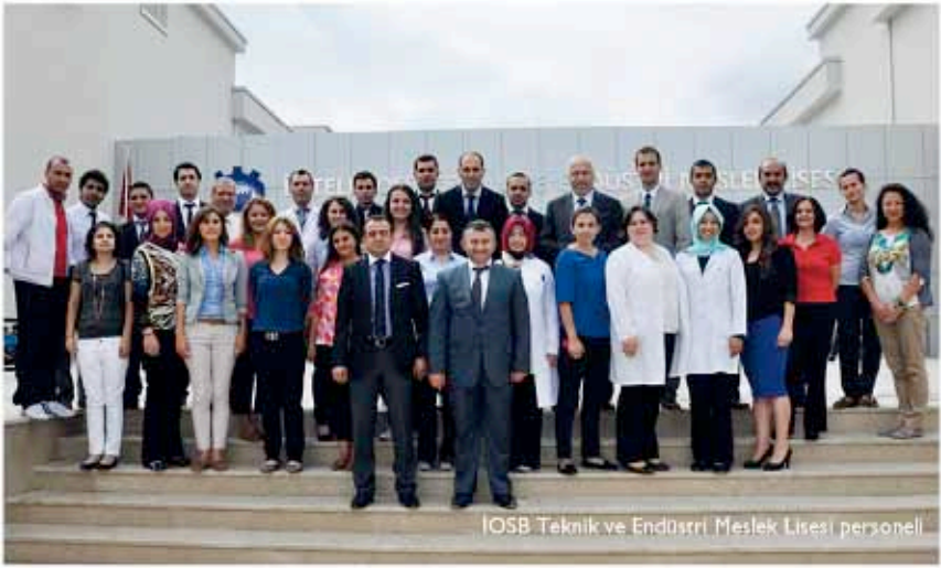
OSB Teknik ve Endüstri Meslek Lisesi personeli

nu yaşıyoruz. Eğitim-öğretim kadrosunda ki bütün hocalarıma, idarecilerime, değerli velilerimize, çok kıymetli öğrencilerimize geleceğimiz olan sizlere bu eğitim-öğretim yılının hayırlı olmasını diliyorum. Biz bu okulun temelini, İkitelli Organize Sanayi Bölgesi Başkanım İstanbul Valisi, Sayın Hüseyin Avni MUTLU, Bilim Sanayi ve Teknoloji Bakanımız Sayın Nihat Ergün ile birlikte 22 Kasım 2012 tarihinde atık. 22 Kasım tarihinden bugüne bu okulu yetiştirmenin azmi, gayreti içinde olduk. 277 OSB içinde sayısal veriler olarak en büyüğü olan İkitelli Organize Sanayi Bölgemizdeki eğitim eksikliğini gördük ve ülkemiz, sizler, İstanbul için kolları sıvayıp bugüne geldik. Bu okulu İstanbul'un en elit meslek lisesi yapacağız. Hep birlikte bu yolda başarıyı yakalayacağız. Peygamberimiz Hz. Muhammed diyor ki: "Beşikten mezara kadar ilim öğrenin". Sevgili öğrenciler her şey sizin elinizde. Çok güzel bir eğitim