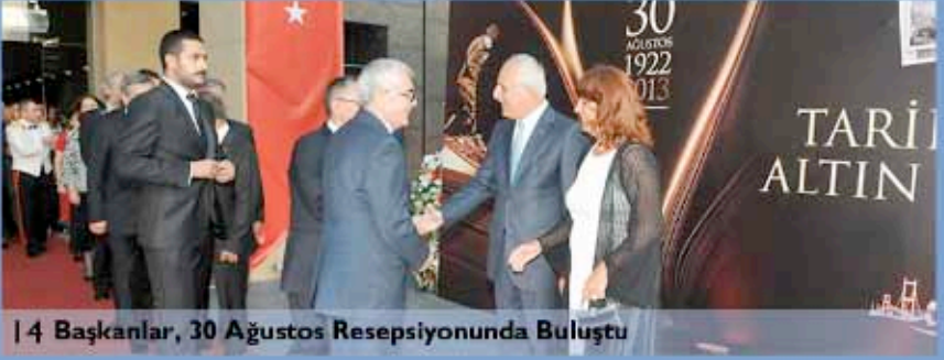
14 Başkanlar, 30 Ağustos Resepsiyonunda Buluştu