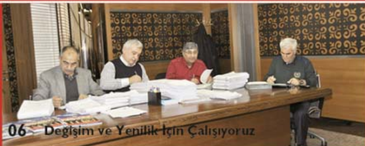
06 Değişim ve Yenilik İçin Çalışıyoruz