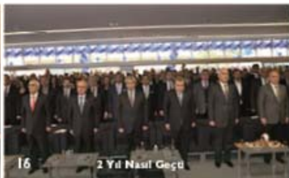
16 2 Yıl Nasıl Geçti