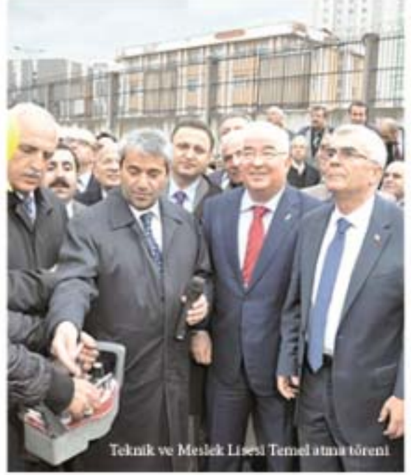
Teknik ve Meslek Lisesi Temel atma töreni

Başkanlığımız çalışanlarının rahat, mutlu ve huzurlu bir ortamda çalışabilmelerini, katılımcılarımızın ise sorunsuz hizmet alabilmelerini sağlayacak Hizmet Binamızın açılışını gerçekleştirdik.