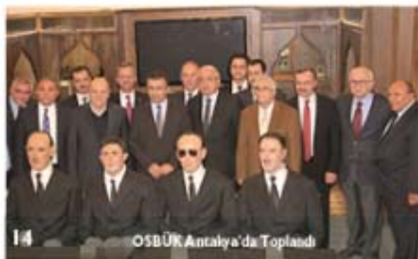
14 OSBÜR Antalya'da Toplandı