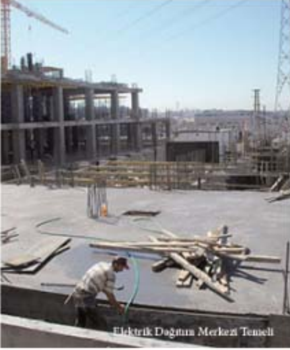
Elektrik Dağıtım Merkezi Temeli

Başkanlığımız İkitelli'ye çok önemli iki yatırım kazandırdı. Elektrik Dağıtım ve Kumanda Merkezi ile İkitelli OSB Teknik ve Endüstri Meslek Lisesi'nin temelleri atıldı.