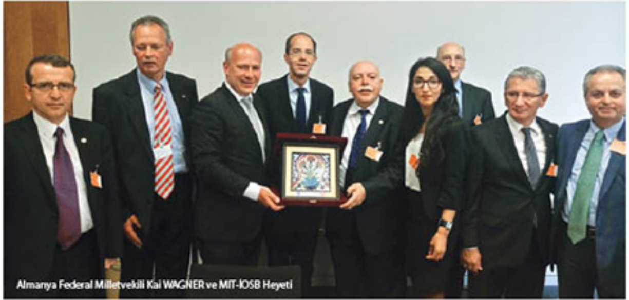
Almanya Federal Milletvekili Kai WAGNER ve MIT-İOSB Heyeti

da yüz yüze görüşmelerin sağlanmasının düşünüldüğünü, devamında bilgi akışının kesintisiz sürdürülmesi ve yatırım yapılabilecek alanlar ile iki ülkedeki teşviklere dikkat çekilmesinin öngörüldüğünü, Türk-Alman KOBİ forumuna Berlin'den en az 100 şirketin katılımının sağlanmasının, Türkiye'den ise mümkün olan en yüksek sayıda katılımcının beklendiğini, pek çok alman şirketinin Türkiye'de tanınmak için bir arayış içerisinde olduğunu ifade etti.