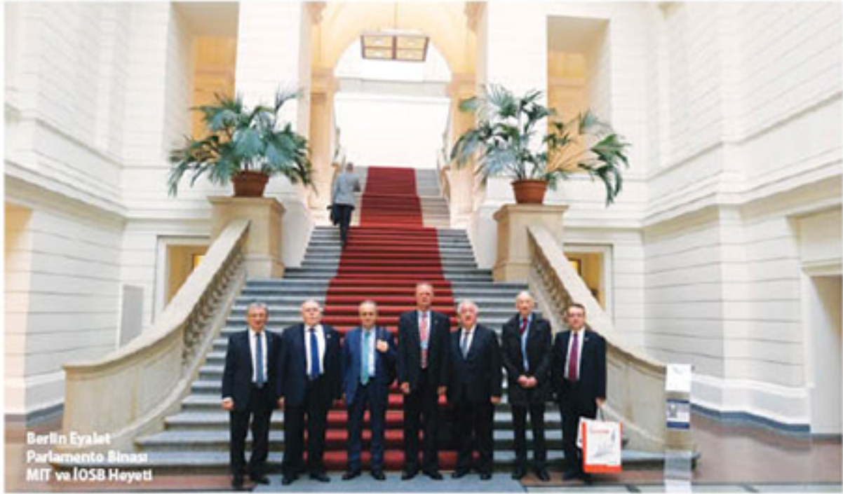
Berlin Eyalet Parlamento Binası MIT ve İOSB Heyeti

cu bulunuyor. 2020 yılından itibaren Almanya'daki hiç bir eyaletin yeni bir borçlanmaya giremeyeceği konusunda kanun çıkarıldı. En önemli gider kaleminiz son yıllarda gelen mültecilere yapılan harcamalardan oluşuyor.”