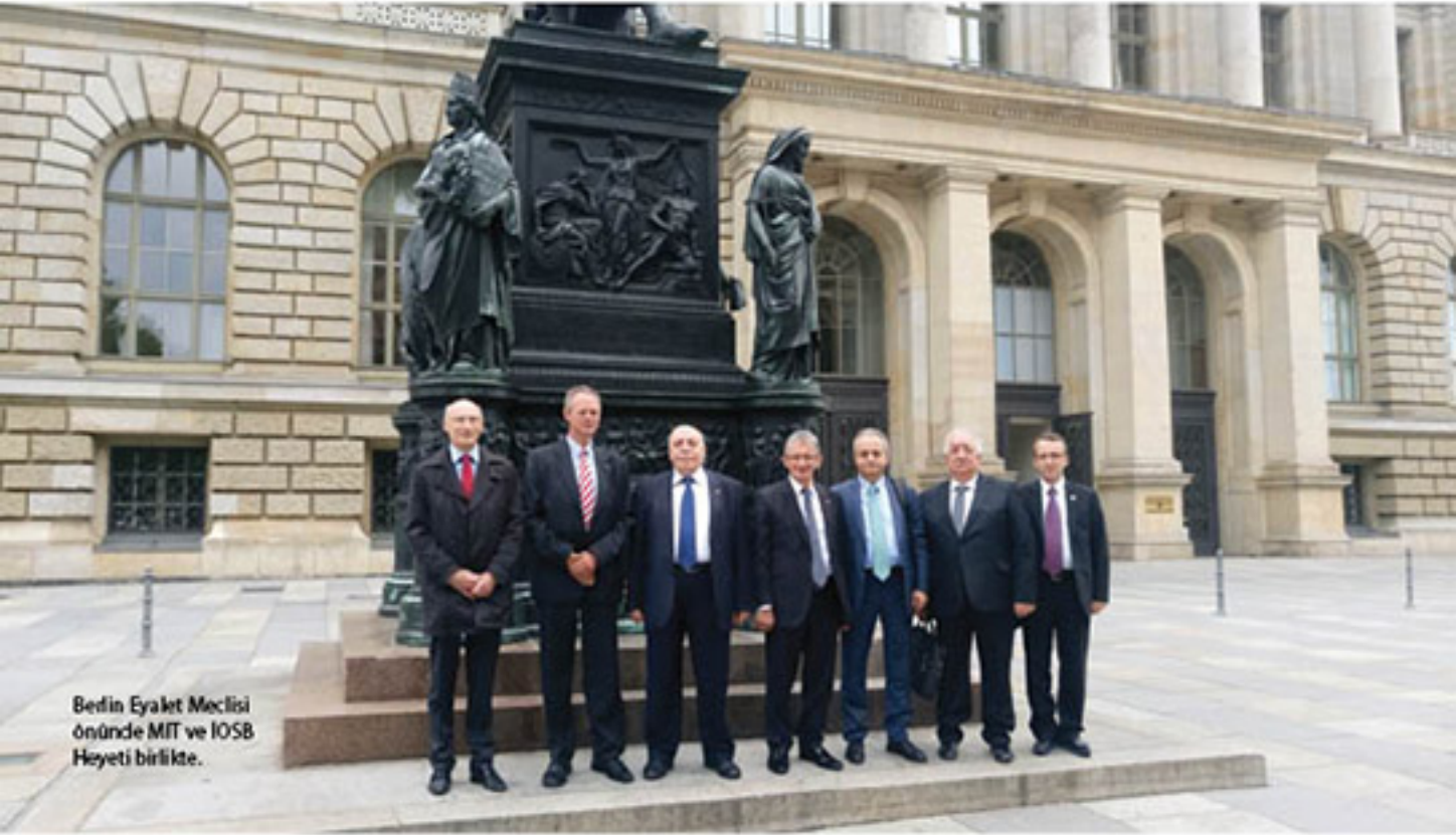
Berlin Eyalet Meclisi önünde MIT ve İOSB Heyeti birlikte.