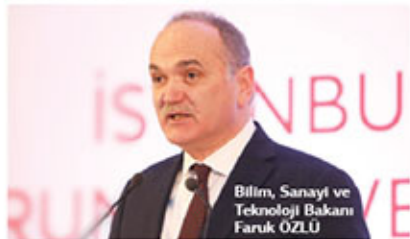
Bilim, Sanayi ve Teknoloji Bakanı Faruk ÖZLÜ

İstanbul OSB'lerinin Sorunları İSO Toplantısında Ele Alındı