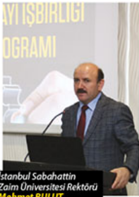
Istanbul Sabahattin Zaim Üniversitesi Rektörü Mehmet BULUT

5000 lisans, 2000 lisansüstü öğrenci demek hızlı bir yönelimi ifade ediyor. Bu üniversitenin öncelikli sloganı; "İyi bir eğitim"