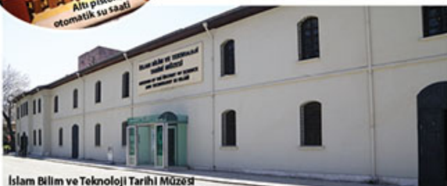
Islam Bilim ve Teknoloji Tarihi Müzesi

belki de babasından daha çok tanınıyordur.