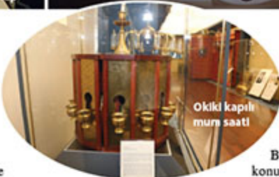
Okuklu kapılı mum saati

ÇETİNKAYA: Tabii inanıyorum ben. Bir tek İslamofobi değil, İslamla ilgili bütün yanlış ve hatalı bakışların hepsini düzeltir. İslamın bilim ve ilime dayalı olduğunu öğrenecekler. Gerçi hocamızın bilimin vatana olmaz der. Yani bilim buradan çıktı ise buraya aittir diye bir şey yok. Enstitü, İslamofobi dâhil olmak üzere İslama yönelik bütün yanlış anlamalara açıklık getirecektir.