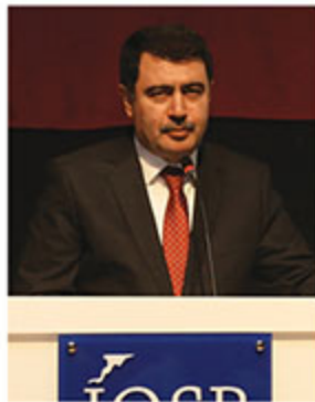
GÜLBAHAR'ın ardından söz alan İstanbul Valisi, İkitelli OSB

el koydu ve bu tehlikeyi atlattığımız oldu. Tabii bunun adına darbe demek asla doğru değil. Bu bir işgal ve iç savaş hareketiydi. Nitekim Kıbrıs'ta, İncirlik'te on binin üzerinde yabancı askerlerin konuşlandığı tarzında pek çok ifade ortaya çıktı. Hamdolsun Türkiye istikrara doğru yol alıyor. Bu arada Sayın Cumhurbaşkanımız istihdam istihdam istihdam diyor. Türkiye yeni bir yolun yolcusu ve yeni bir kaderin sahibi olma durumuyla karşı karşıya görünüyor. Bu yol, Türk milletini bilimde, teknikte, ahlakta, fazilette yeryüzünün en ileri ülkesi yapmak isteyenlerin de yolu olacaktır. Bunun da adı milli devlet, güçlü iktidar demektir. Milletimiz, milli iktidarımız fevkalade güçlü olmak durumundadır. Yapılacak referandum bunun ilk adımı olacaktır. İnsanlarımız vicdanlarıyla doğru olanı yapacaktır. Zaten Türk milleti her zaman doğru olanı yapmıştır. Ben zamanınızı fazla almamak üzere; "Gök mavî, başak sarışın, tadı ne güzel barışın. Ey vatan on savaşa değer senin her karışın diyor, herkese saygılar sunuyorum." İfadelerine yer verdi.