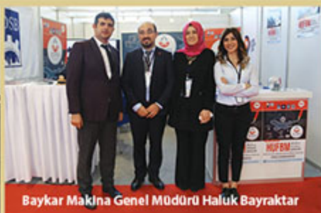
Baykar Makina Genel Müdürü Haluk Bayraktar