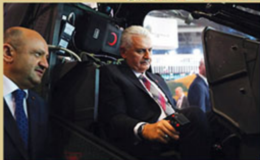
BAĞIRCIK İÇAY FARKINDALIK VE BİLGİ MERKEZİ (BAFİM) POLİSİ