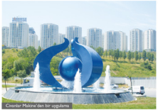
Civanlar Makine'den bir uygulama

Dönüm noktasız piyasada bize karış yapılan hakozluklardı. Ve kendi içimizdeki potansiyel fark ederek, dersler almamız ve sonucunda elde ettiğimiz başarıdır. Kişinin bilgi ve iş birliği ve bunu kullanması firmaların en büyük sermayesidir.