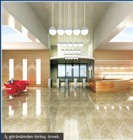
İç görünümünden birkaç örnek.

Binada 328 kişilik restoran / yemekhane haricinde bir lokal ve 400 kişilik bir konferans salonu da bulunmakta. Konferans salonu her türlü simültane işlemlerine elverişli biçimde tasarlanmış. Yaklaşık 35 kişilik Müteşebbis Heyet Odası'na sahip olan binada güvenlik sistemlerinden aydınlatma sistemlerine dek her şey düşünülmüş. Toplamda 9 katı, 3 bodrumu olan İOSB'nin yeni binasının yaklaşık 60 araç kapasiteli kapalı otoparkı ve 10 - 12 araçlık açık otoparkı mevcut.