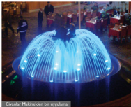
Civanlar Makine'den bir uygulama

Sen dönemde iyileştirme yapılırsa da aydınlatma önemli bir konu. Bunun yanında yol ve asfaltlama probleminiz var. Her yer birçok kez kazılıp yapıyor. Ayrıca yılın 365 günü bir fuar alanı olması fikri ilginç, uygulanabilir ancak bunun için öncelikle kendi içimizde ve firmalarla sını dışıyalog içinde olunmak. İOSB'nin tanıtılması amacıyla tanıtım günü adı altında yurt dışındaki İOSB'lerin yetkilileri ve başkanları çağrılabilir. Türkiye'de bu konuyla ilgili güzel bir örnek var. Uzak Doğuda imalat yapan birçok firma daha küçük alanlarda daha çok iş yapıyor. Bir ürünü 100 firma değil ama işi en iyi yapacak kişiler, hepsine bir ürün hakkı vererek adaleli bir dağılıma çalışıyorlar. Bizim beklentimiz sektörel birleşmelerin oluşturulup, daha güçlü ve daha iyi bir üretim yapılması. İOSB bu konuda bize öncü olmak. Mesela paneller düzenlenirse işi göreceğini düşünüyorum.