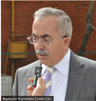
Başakşehir Kaymakamı Cevdet Can

Başakşehir Kaymakamı Cevdet Can, Başakşehir'in İOSB ile birbirini tamamladığını belirterek, sorunların bu yıl çözüleceğini söyledi.