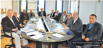
İPKAS Kooperatif Yönetimi iş toplantısında.

Daha da hızlı gelişeceğini düşünüyorum. İlk yerler inşa edilirken günümüz gereksinimleri düşünülmemiş dolyayla dükkanlar dar ve küçük. 25 sene önceki bakış açısına göre dükkanlar 120 metrekareyeken günümüzün bakış açısına göre bu oran 2500 - 3000 metrekareye çkıyor. Kıtelli Sanayi Bölgesi geliştği için artık yerler yetmiyor.