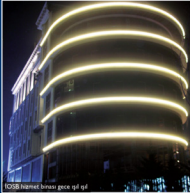
İOSB hizmet binası gece ışıl ışıl

İkizelli Organize Sanayi Bölgesi İOSB Başkanlığı'nın yaptırdığı modern hizmet binası tamamlandı. Toplam 10 bin metrekare kapalı alanı bulunan