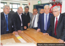
Heyet, ahşap atölyesini incelerken.

adet kütüphane, 2 adet seminer odası, 1 adet toplantı salonu, 2 adet fen bilimleri laboratuvarı, 2 adet yabancı dil laboratuvarı ile idari odalar bulunacak. Meslek lisesi müfredat bölümleri ise Metal, Motor, Elektrik ve elektronik ile CNC şeklinde olacak. İŞLETMELER ÜSTÜ MESLEKİ EĞİTİM TEKNOLOJİ MERKEZİ İOSB'nin projelendirdiği en önemli adım "İşletmeler Üstü Eğitim ve Teknoloji Merkezi" olacak. Almanya'da