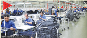
OZAK TEKSTİL'de üretilen bir kaza.

Dikim 2'de çalışıyorum. Ulaşım konusunun iyileştirilmesini istiyorum. Personel servislerini kullanmadığımız durumlarda iş yerine ve İkitelli içerisinde ulaşım çok zor oluyor. Araçlar çok geç geliyor ve özellikle yoğun saatlerde duraklarda durmayabiliyorlar. Araçların içleri tıklım tıklım dolu oluyor dolayısıyla işe ya da gideceğimiz yerlere geç kalabiliyoruz. İkitelli'ye ait araçların çoğaltılarak, ulaşımın iyileştirilmesini istiyorum.