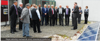
Hayat teknoloji merkezinde enerji sistemlerini incelerken.