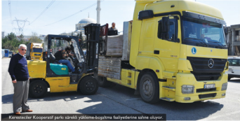
Karatesticiler Kooperatifleri parkı sürekli yükleme-boşaltma faaliyetlerine sahne oluyor.

bizler değil düşünebiliyor. musun ayakta duran hala Godıkpaşa'dan buraya getiremediler.