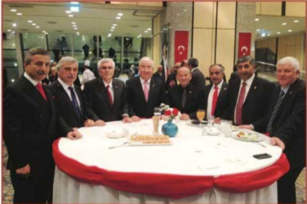
IOSB Yöneticileri 29 Ekim resepsiyonunda

Resepsiyona, İstanbul Valisi Hüseyin Avni Mutlu ve eşi Gül Mutlu'nun yanı sıra İstanbul Büyükşehir Belediye Başkanı Kadir Topbaş , I. Ordu Komutanı Orgeneral Yalçın Ataman ve eşi, şehit aileleri, sanat, iş ve medya dünyasından önemli isimler katıldı.