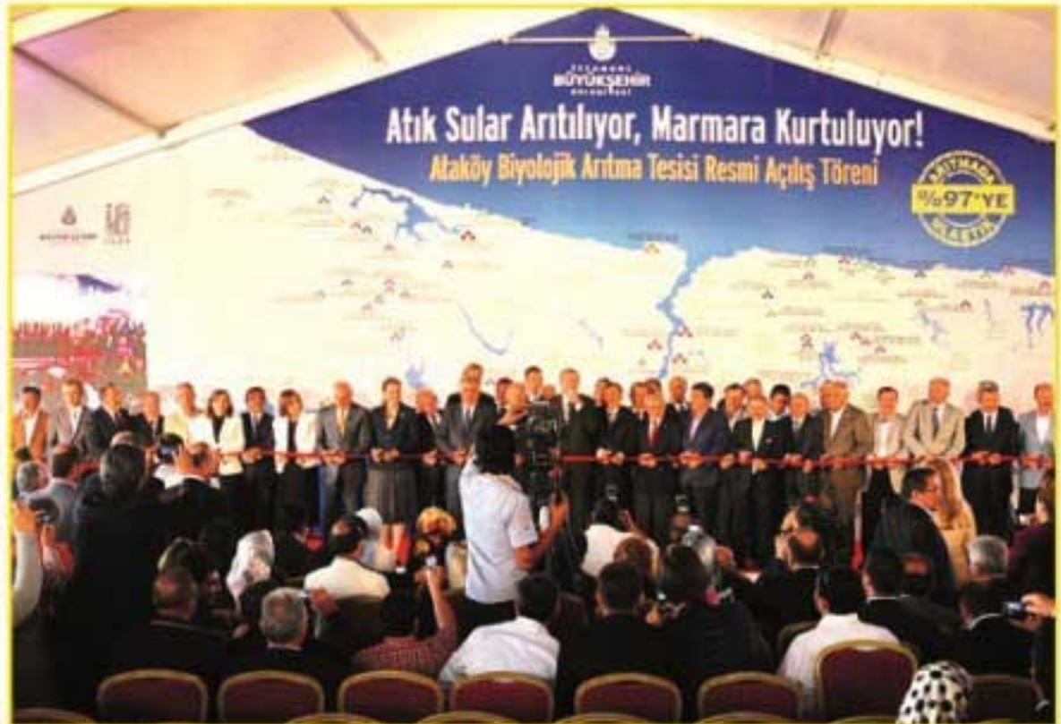
Açılışın bir görüntü

lojik Arıtma Tesisi yapılmasıyla her yıl 341,6 ton katı atık, 1.240 ton atık kum, 58 bin 617 ton atık karbon, 3 bin 527 ton atık azot ve 722 ton atık fosfor kirlenici Marmara Denizi'ne akacaktı. İleri biyolojik arıtma yapılan tesiste karbonun yanı sıra azot ve fosfor giderimi de sağlanarak, sudaki canlı yaşama hayat veriliyor. Çamur kurutulurken, 40 kamyonla taşınabilecek günlük 500 ton çamur, 10 kamyonluk kuru ürün haline getiriliyor. Arıtılan sular park-bahçelerde ve sanayide kullanılıyor. Arıtılan su, talep gelmesi halinde sanayide de kullanılacak kalitede.