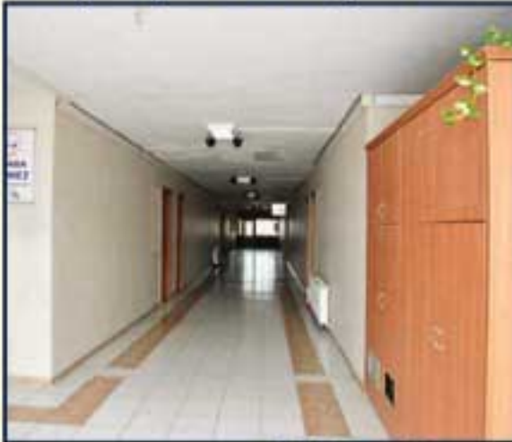
Eski Hizmet Binası girişi

lığı'na devretmeden İOSB'nin işleteceği ve öğrenci başına MEB'den destek alacağı projenin yapımına başlandı. Okul sağ üst resimde gördüğünüz şekilde olacak. Endüstri Meslek Lisesi'nin yanında ise İSTESOB'un yaptırdığı İşletmeler Üstü Eğitim Merkezi inşaatının temeli atıldı.