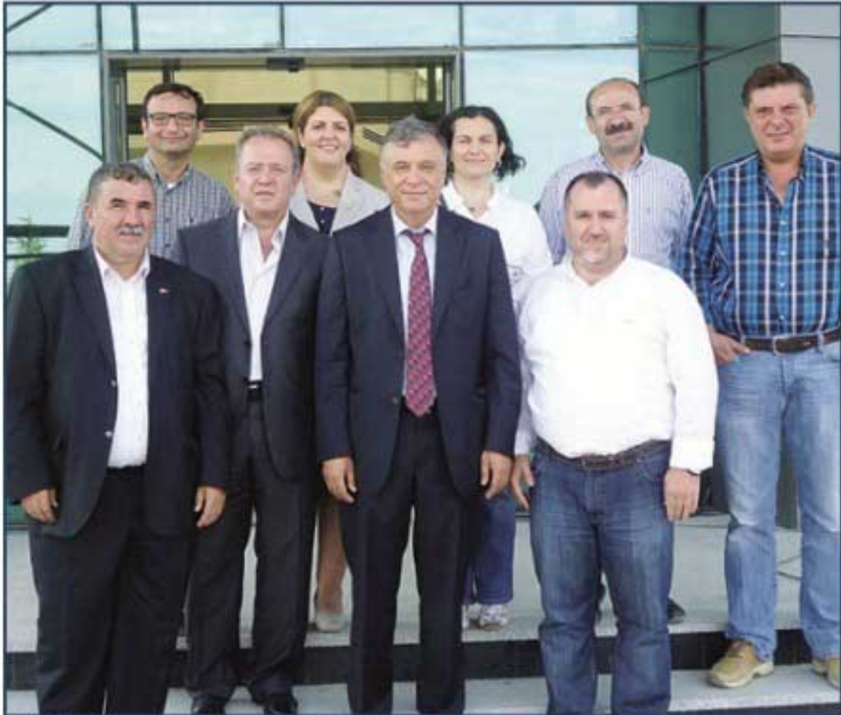
İOSB teknik heyeti gezi sırasında hatıra fotoğrafı çektirdiler

bölgenin ortak alanlarını (sağlık birimi, eğitim birimi, spor alanları), konferans salonu inşaatını ve eğitim merkezlerini inceleyerek, yapmış oldukları projelerle ilgili bilgi aldılar. Bünyesindeki fabrikaları da inceleyen heyet aynı gün dönüş yaptılar.