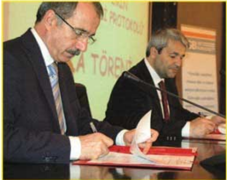
Milli Eğitim Bakanı Ömer DİNÇER ile Bilim, Sanayi ve Teknoloji Bakanı Nihat ERGÜN

OSB'ler ve katılımcıları için son derece önemli ve bir o kadar da sorumluluk gerektiren söz konusu görev ve yetkilerin: minimum maliyet ve azami verimlilik sağlanarak kullanılması ve OSB'ler için yeni bir alan olan mesleki ve teknik eğitim konusunda bilgi edinilmesi, sorunların