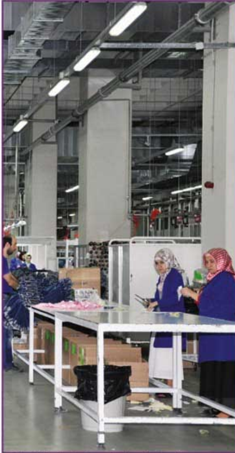
İkitelli OSB'de tekstil sektöründe çalışan kadın işçiler

ya genelinde çalışma yaşamına katılan kadın sayısında önemli artışlar kaydedilmiş olmakla birlikte kadının çalışma yaşamında aynı doğrultuda bir iyileşme olmamıştır.