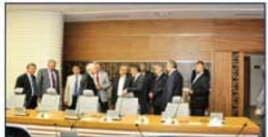
Konaklarımız görüşmeden sonra yeni binamızı gezip hatıra fotoğrafı çektirdiler.