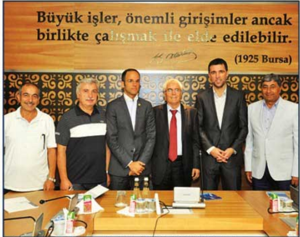
İOSB Yöneticileri, İstanbul Milletvekilleri Hakan ŞÜKÜR ve Faik TUNAY brifingden önce.

hukuk alanında hizmet veriyoruz. Bunun yanında elektrik toptan satış şirketimiz, yine çelik boru üretimi ve sıkıştırılmış doğalgaz satışı yaptığımız şirketlerimiz var. Bu alanların her birinde etkin olarak hizmet veren tek çatı altında toplanmış ve 8 yıldır faaliyet gösteren